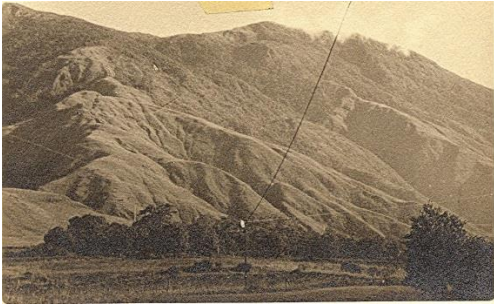
aprox.1933