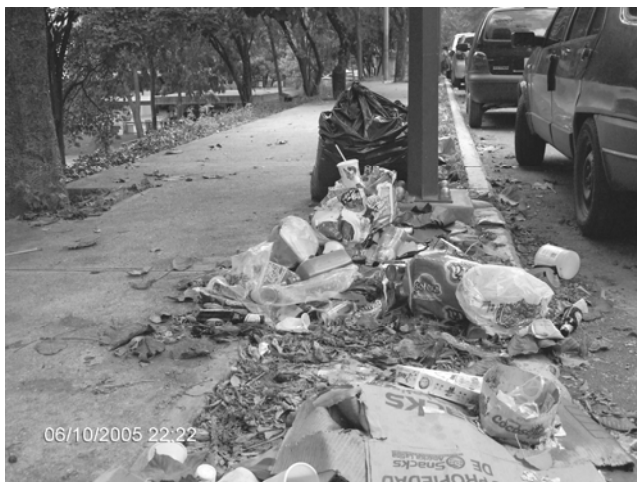
La acera detrás del edificio de Idioma y Administración

consecuencia, sino teniendo consciencia de que esto también conlleva a un deterioro visual con repercusiones en la psique de quienes hacemos uso de estos espacios, así como a una eventual degradación del ambiente universitario.