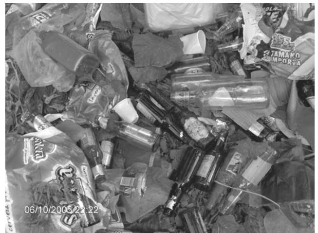
Se observa una gran cantidad de botellas