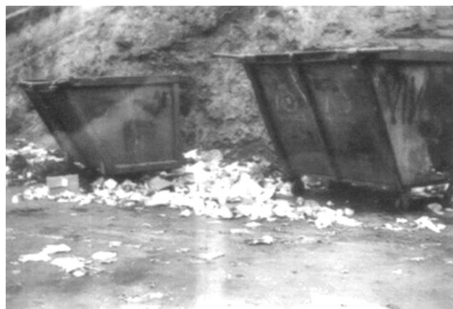
Los contenedores del Centro de Acopio

Serra comenta que se han tomado algunas medidas correctivas, como remover los contenedores para eliminar la contaminación visual pero la recolección de basura doméstica hay que abordarla en varios niveles. Otras de las medidas a corto plazo son: la selección de un sitio provisional para colocar todos los contenedores; fijar puntos de recolección de desechos con sus horarios; diseñar una ruta interna -porque FOSPUCA simplemente no recogía- con un camión 310 que la UCV tuvo que comprar para organizar este circuito y llevarlo todo arriba al Centro de Acopio. Al momento de la entrevista se estaban realizando