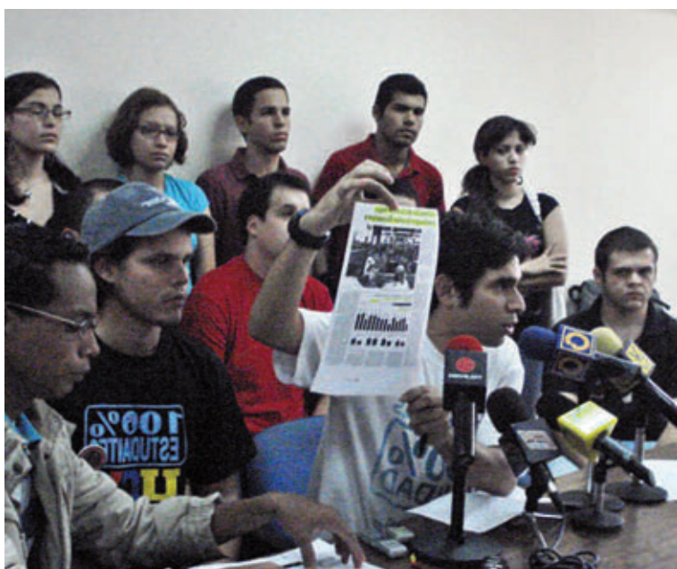
Rueda de prensa FCU