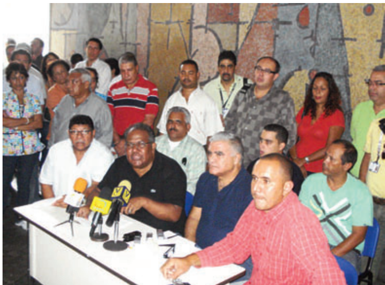
Rueda de prensa trabajadores universitarios