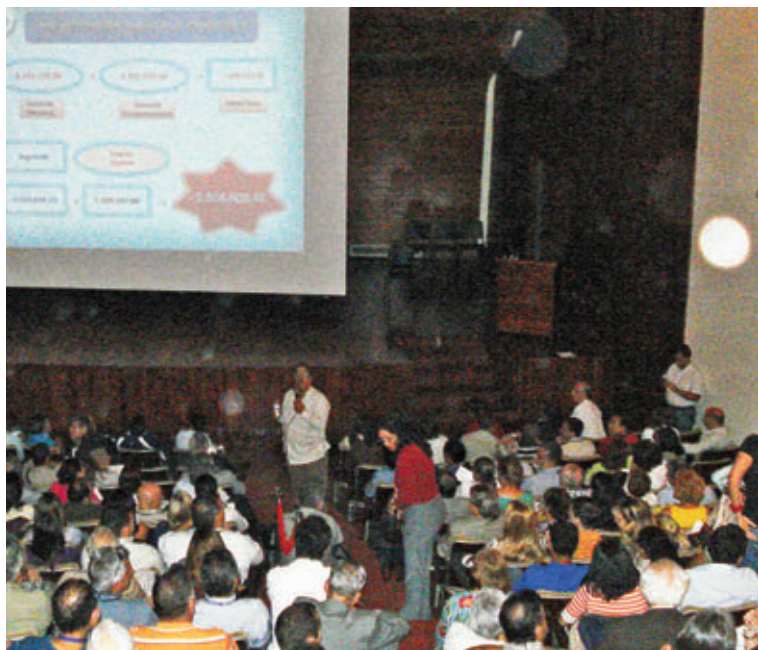
Asamblea de la APUCV