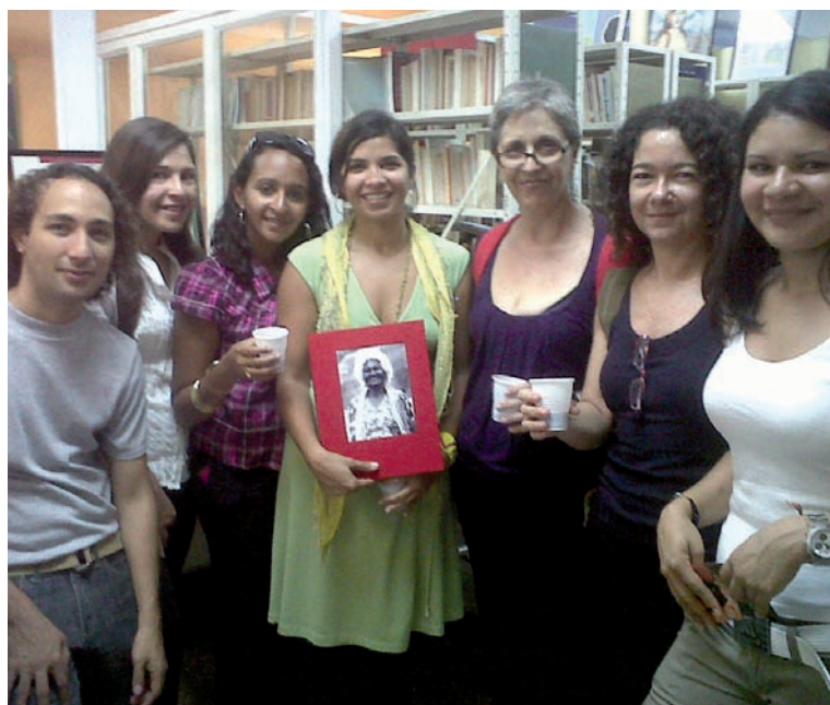
El Centro de Documentación Tecla Tofano: iniciativa única en la UCV.

Además, cuenta con una biblioteca actualizada de publicaciones; investigaciones, trabajos de grado y de ascenso, revistas, materiales audiovisuales en temas como historia de las mujeres, teoría y filosofía feminista, feminismo venezolano, biografía, violencia de género, entre otros.