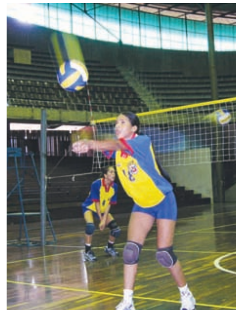
Distintas disciplinas, entre ellas el voleibol, se hicieron presentes en la liga