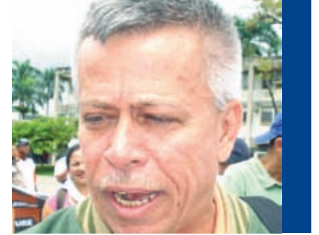
Prof. Raúl López Rector de la UPEL

"Las universidades no pueden seguir viéndose afectadas por las palabras del Ministro, ni por esa promoción indebida que se ha hecho contra ellas. No es sólo el aspecto presupuestario, que limita el resto de las actividades. Desde el punto de vista curricular, no puedo admitir que nos impongan un currículum único para todas las universidades. La autonomía no sólo se refiere a cómo manejas tus fondos, sino al aspecto académico".