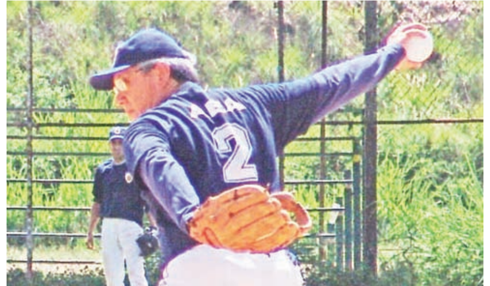
Encuentro de Softbol dio inicio a la Liga Polideportiva

En horas de la mañana de ese mismo sábado 22 de mayo, se dio apertura al voleibol. En esta oportunidad, el Gimnasio Cubierto, "La cachucha", recibió a los equipos de Medicina y Estadística, del femenino A, donde las galenas llevaron la peor parte, perdiendo ante sus rivales dos sets por cero. Continuaron la tanda los equipos de Educación y Sociología del femenino B, alcanzando el triunfo las educadoras (2x0), sobre las sociólogas.