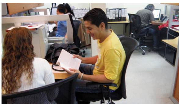
Redacción de la DIC