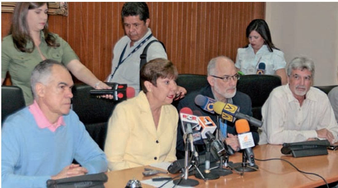
Autoridades universitarias alerta ante deficitaria asignación presupuestaria.

En su sesión del pasado 7 de octubre, el Consejo Universitario aprobó, por decisión unánime, defender el 52% del presupuesto universitario que dejó de ser asignado por el Ejecutivo y acordó solicitar a la OPSU este monto que quedó pendiente, especificando por rubro cada una de las deficiencias presupuestarias. Asimismo, acordó solicitar ante la Asamblea Nacional todos los recursos que la universidad requiere.