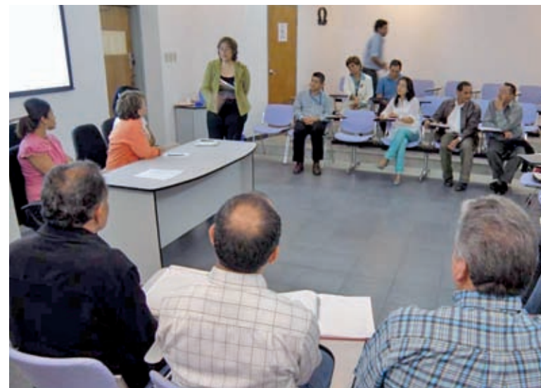
Autoridades de la Facultad de Ingeniería se reunieron con representantes del Ministerio del Poder Popular para el Comercio

“Necesitamos que los grupos de las universidades, los la-