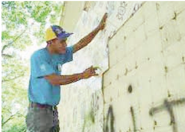
Las obras de restauración avanzan en la Biblioteca "Gustavo Leal"

sado 20 de enero, se comenzaron los trabajos de rescate de la fachada de la Biblioteca Gustavo Leal, de la Escuela de Comunicación Social, Facultad de Humanidades. Hasta ahora se ha realizado la remoción de las cerámicas que se encontraban en peligro de desprenderse y fracturarse.