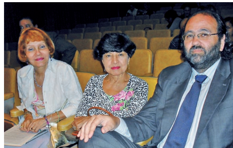
Investigadores expusieron sus ideas sobre el hecho educativo