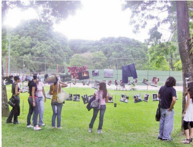
Frente a la escuela de Comunicación, se apreció la muestra fotográfica

En los espacios ubicados frente a la ECS se llevó a cabo el pasado lunes 26 de abril la tercera edición de este evento, el cual tuvo por nombre "Caracas en 5 fotos". Los trabajos expuestos tenían como tema las diferentes visiones de la ciudad de Caracas. Más de 100 fotos fueron colocadas en un tendedero al aire libre, cual prendas de vestir, para el de-