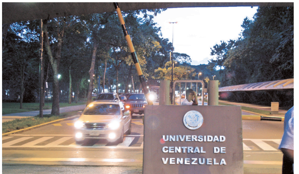
Con una imagen renovada, la UCV da la bienvenida a los miembros de la comunidad y los invita a colaborar con el mantenimiento de los espacios y el uso de la calcomanía

Los requisitos que exigen para adquirirla al personal docente, profesional, administrativo y obrero, es el original del carnet de circulación o del documento notariado, y el original del carnet universitario vigente o último recibo de pago. En el caso de los estudiantes, el original del carnet de