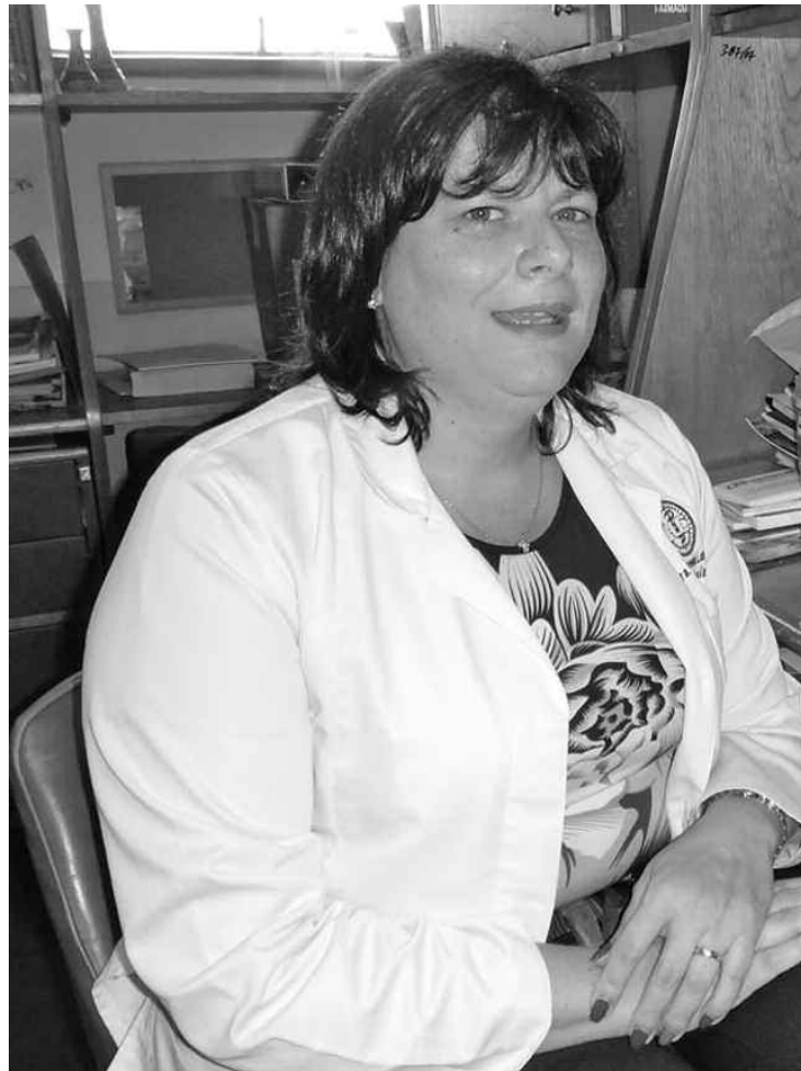
La infectóloga María Eugenia Landaeta alertó sobre la insuficiencia de dosis para vacunación que existe en el sistema de salud venezolano

La también microbióloga alertó de la insuficiencia de dosis que se maneja en el sistema de salud venezolano, por lo que exhortó al gobierno a adquirir suficientes vacunas, especialmente para la población de riesgo (personas mayores, niños menores de cinco años, embarazadas, personas con patologías pulmonares, con cáncer o enfermedades inmunológicas y personal de salud,