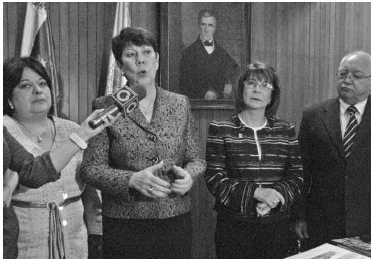
Rectores de la AVERU sostienen que las Normas de Homologación están vigentes y se rigen por la Ley de Universidades

A este respecto, agregó que AVERU consignará el próximo lunes 10 de junio, un documento que "contendrá todo los aspectos legales que explican por sí solos, las demandas sobre Normas de Homologación que rigen los