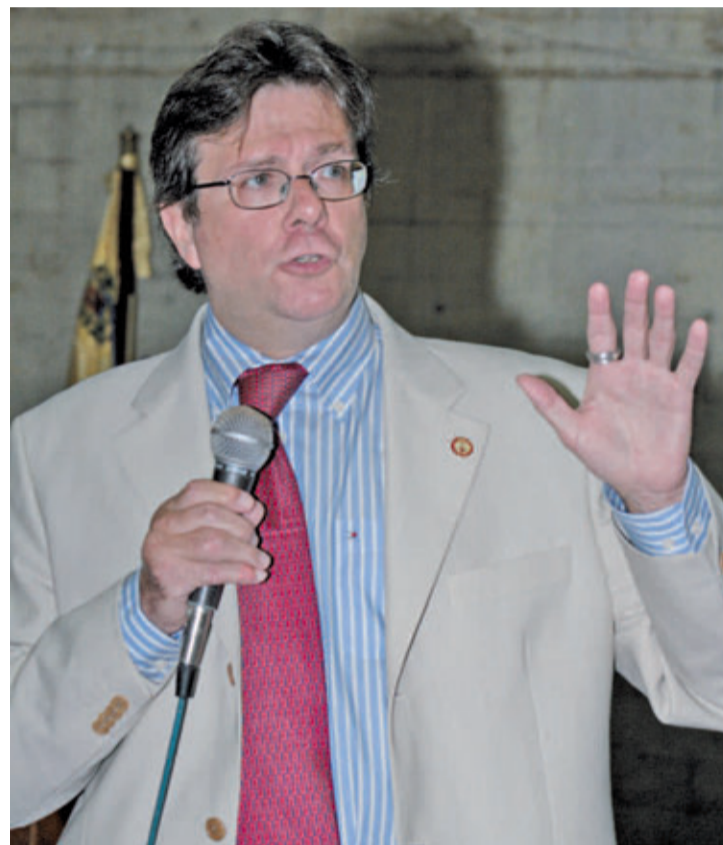
La conferencia central estuvo a cargo del profesor Julio Cabero, de la Universidad de Sevilla, España.

Sin embargo, expresó Cabero que la implantación de las tecnologías, no está resolviendo los problemas educativos del fracaso y aburrimiento estudiantil; pues su uso se está centrando en el terreno de la información y no del conocimiento; sus avances se han producido en el terreno tecnológico-instrumental y no en sus potencialidades educativas y comunicativas, por lo que se observa una fuerte dispersión entre el dominio que tienen los alumnos y el que poseen sus profesores.