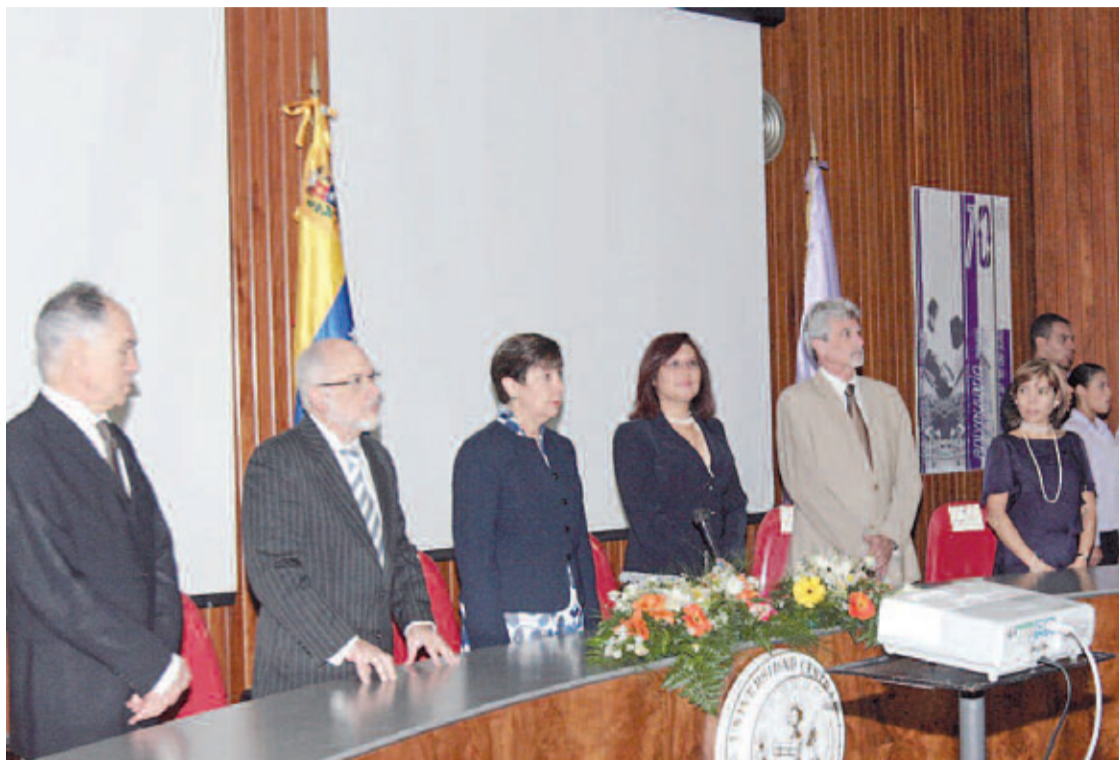
Autoridades universitarias estuvieron presentes en los actos para celebrar el aniversario de la Facultad.

“La Facultad de Odontología, atiende en la actualidad 350 pacientes diarios, entre los cuales destacan personas con HIV, sida, y otras enfermedades infecto-contagiosas como hepatitis y tuberculosis”