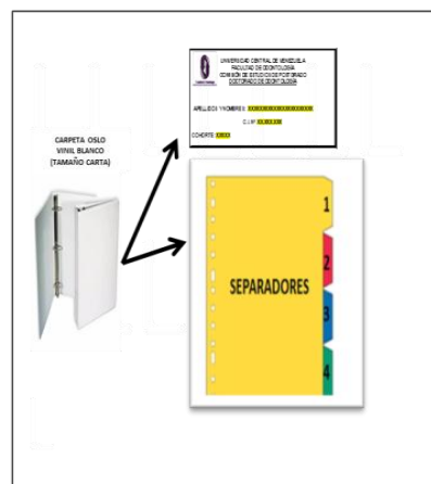
FIGURA. N° 1: ETIQUETA