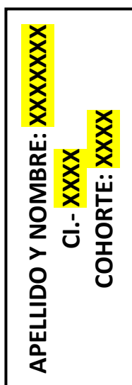
FIGURA. N° 2: ETIQUETA LATERAL