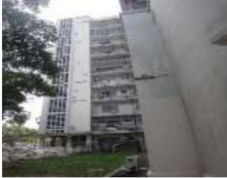
Mal acabado en la reparación de los frisos