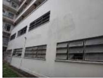
Mal acabado en la reparación de los frisos