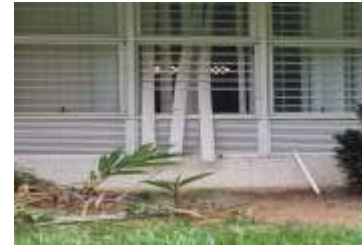
Evidencia de intentos de vulneración en ventanas