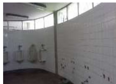
Vistas de deterioro: impermeabilización del techo, friso interno del techo, carencia de piezas sanitarias