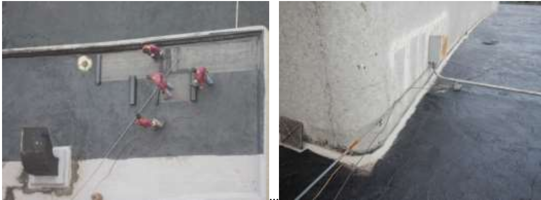
Trabajos de colocación de la capa impermeabilizante. Colocación de las instalaciones separadas del manto.