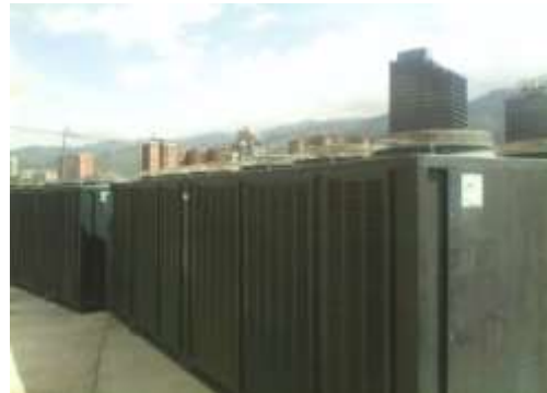
Supervisión de obra de colocación del chiller en la losa de techo adyacente a la Sala de Conciertos