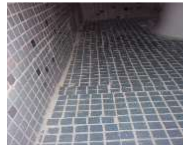
Problemas a subsanar en sanitarios de Judo de colocación de revestimiento y de acabados