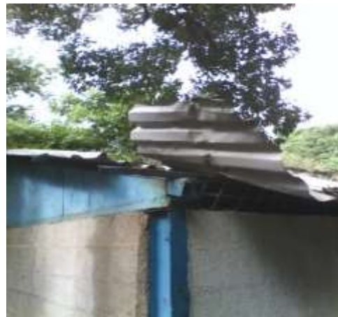
Techo del Taller de Plomería.