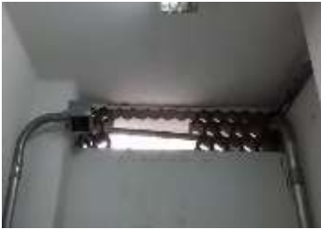
Áreas vulneradas a través los cerramientos de bloques