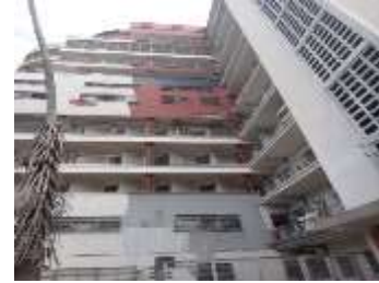
Vista parcial de algunas áreas de las fachadas.